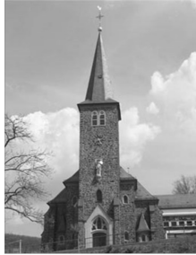
St. Laurentius Rudersdorf Schützenstr. 1 57234 Wilnsdorf