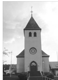
St. Johannes Ev. Gernsdorf St.-Johann-Str. 10 57234 Wilnsdorf

Kleinkindergottesdienst: Am Sonn- tag, 5. Juli , um 10.30 Uhr. Weitere Infos auf Seite 8.