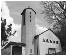
Maria Königin Eisern Rinsdorfer Str. 8 57080 Siegen

Senioren-gottesdienst im Haus Sonne am 24. Juli um 11 Uhr