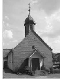
St. Antonius Anzhausen Antoniusstr. 6 57234 Wilnsdorf

Das Pfarrbüro ist bis 4. Juli geschlossen.