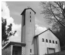
Maria Königin Eisern Rinsdorfer Str. 8 57080 Siegen

Senioren Gottesdienst im Haus Sonne am 22. Mai um 11 Uhr.