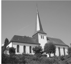
St. Johannes Bapt. Rödgen Höhenweg 6 57234 Wilnsdorf