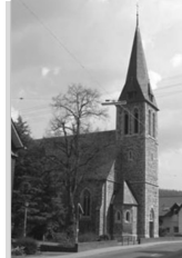
Herz Jesu Niederdielfen Siegener Str. 10 57234 Wilnsdorf

Senioren Gottesdienst im Haus Sonne am 22. Mai um 11 Uhr.