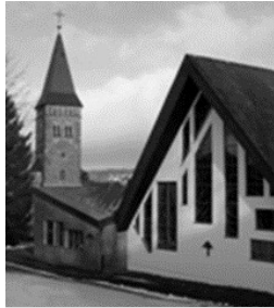
St. Martinus Wilnsdorf St.-Martin-Str. 1 57234 Wilnsdorf