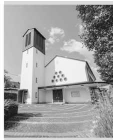
St. Josef Wilgersdorf St.-Josef-Weg 2a 57234 Wilnsdorf