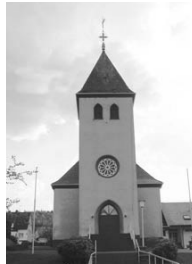
St. Johannes Ev. Gernsdorf St.-Johann-Str. 10 57234 Wilnsdorf

In der Fastenzeit wird immer dienstags um 18 Uhr herzlich zur Kreuzwegandacht eingeladen.