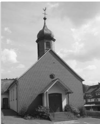
St. Antonius Anzhausen Antoniusstr. 6 57234 Wilnsdorf

Ökumenisches Taizégebet: Am Freitag, 21. März , findet das diesjährige Taizégebet in der Fasten-/Passionszeit um 19.00 Uhr in der evangelischen Kirche in Rudersdorf, Nassauer Str., statt. Dieses Gebet wird sich inhaltlich an dieser Zeit im Kirchenjahr orientieren, sowohl in den Texten als auch in der Liedauswahl. Dazu laden wir herzlich alle ein, die für eine Stunde innehalten wollen bei Gebet, Bibellesung, Gesang und Stille. Anschließend besteht die Möglichkeit zur Begegnung im Gemeindehaus oder zum stillen Verweilen in der Kirche.