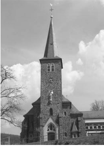
St. Laurentius Rudersdorf Schützenstra- ße 1 57234 Wilnsdorf

Reinigungskraft für Pfarrheim, Pfarrbüro und Jugendheim Rudersdorf gesucht. Interessierte melden sich bitte im Pfarrbüro Wilnsdorf.