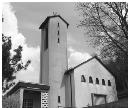
Maria Königin Eisern Rinsdorfer Str. 8 57080 Siegen

Offener Nachmittag im Tagespflegehaus „Eremitage“ : Kaffee, Tee, frisch gebackene Waffeln und Musik am Mittwoch, 11. Dezember , 14.00 - 15.30 Uhr. Infos und Anmeldung: Tel. 0271/39121, a.verbuecheln@caritas-siegen.de