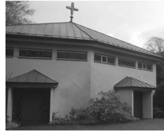
Klosterkirche Eremitage Eremitage 11 57234 Wilnsdorf