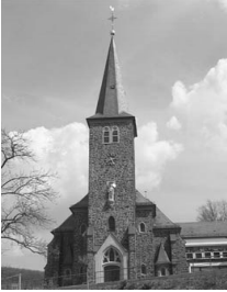
St. Laurentius Rudersdorf Schützenstra- ße 1 57234 Wilnsdorf

Am Sonntag, 1. Dezember , um 16 Uhr, findet die traditionelle „ Stunde im Advent “ des Musikvereins Rudersdorf statt - eine wunderbare Gelegenheit, sich auf die besinnliche Zeit einzustimmen. Neben Musikstücken werden auch Weihnachtsgeschichten vorgelesen. Alle Menschen von nah und fern sind herzlich eingeladen. Der Eintritt ist kostenlos.