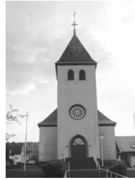
St. Johannes Ev. Gernsdorf St.-Johann-Str. 10 57234 Wilnsdorf

Taizégebet mit dem Friedenslicht aus Betlehem: Der Taizékreis Oberes Johannland lädt zu einem ökumenischen Friedensgebet am Freitag, 20. Dezember , um 19 Uhr in die ev. Kirche Rudersdorf ein. Während des Gebetes wird das Friedenslicht weitergegeben. Wer es als Friedenszeichen mit nach Hause nehmen möchte, bringe bitte eine Laterne o.ä. mit. Gerade in unserer Zeit, da wir täglich von Kriegen, Gewalt und Hass hören, ist es uns ein besonderes Anliegen, für den Frieden zu beten und durch das Licht, das von Betlehem aus in viele Länder getragen wird, ein Zeichen der Verbundenheit zu setzen. Anschließend Beisammensein oder stilles Verweilen in der Kirche.