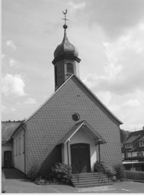
St. Antonius Anzhausen Antoniusstr. 6 57234 Wilnsdorf

Einladung zum vorweihnachtlichen Kaffee/Konzert am Sonntag, 15. Dezember der Chöre des Gesangsvereins Anzhausen. Von 14 bis 16 Uhr werden im Pfarrheim Kaffee und Kuchen angeboten. Anschl. um 17 Uhr laden der Gemischte Chor und Klangfarben zu einem vorweihnachtlichen Konzert ein. Der Eintritt ist frei.