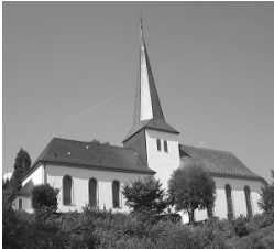
St. Johannes Bapt. Rödgen Höhenweg 6 57234 Wilnsdorf