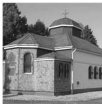
St. Josef Würsgendorf Dillenburg Str. 39 57299 Burbach