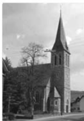
Herz Jesu Niederdielfen Siegener Str. 10 57234 Wilnsdorf