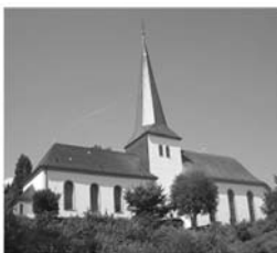
St. Johannes Bapt. Rödgen Höhenweg 6 57234 Wilnsdorf