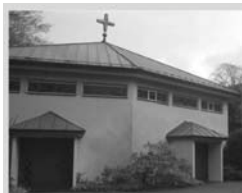
Klosterkirche Eremitage Eremitage 11 57234 Wilnsdorf