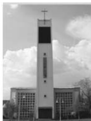
St. Theresia vom Kinde Jesu Neunkirchen Bonifatiusweg 6 57290 Neunkirchen

Am 1. und 3. Sonntag im Oktober findet wie gewohnt um 16 Uhr ein Hochamt in polnischer Sprache statt.