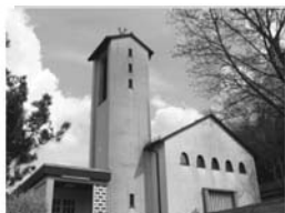
Maria Königin Eisern Rinsdorfer Str. 8 57080 Siegen

am Sonntag, 1. November, Treffpunkt jeweils vor der Friedhofshalle 14.45 Uhr Oberdielfen 15.30 Uhr Niederdielfen