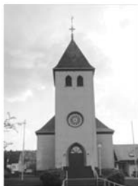
St. Johannes Ev. Gernsdorf Marburger Str. 45b 57234 Wilnsdorf

am Sonntag, 1. November um 12 Uhr Friedhof Flammersbach um 16.30 Uhr Friedhof Anzhausen