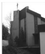
Hl. Kreuz Burbach Fliederweg 4 57299 Burbach