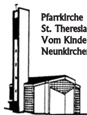
Pfarrkirche St. Theresia Vom Kinde Jesu Neunkirchen

Pfarnachrichten der kath. Pfarrgemeinde St. Theresia vom Kinde Jesu im Pastoralverbund Südliches Siegerland