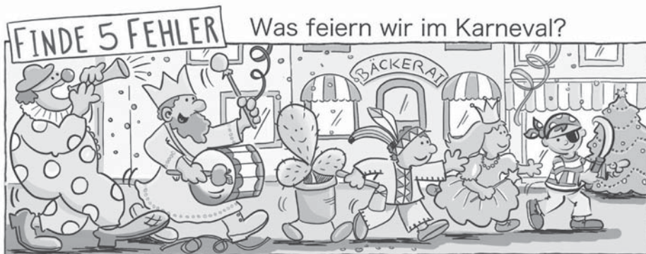
Apfel, Kaktus, Banane, BäckerAI, Weihnachtsbaum

Karneval und Fastenzeit gehören also ganz eng zusammen, doch viele wissen das heute leider nicht mehr. Sie feiern Karneval, doch an die Fastenzeit denken sie nicht. Das ist eigentlich schade.