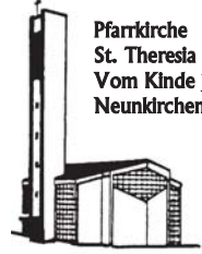
Pfarrkirche St. Theresia Vom Kinde Jesu Neunkirchen

Pfarnachrichten der kath. Pfarrgemeinde St. Theresia vom Kinde Jesu im Pastoralverbund Südliches Siegerland