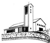
Maria Königin Eisern