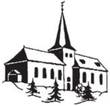
St. Johannes Baptist Rödgen