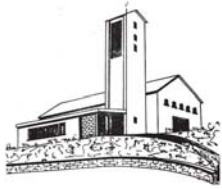
Maria Königin Eisern