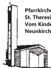
Pfarrkirche St. Theresia Vom Kinde Jesu Neunkirchen

Pfarnachrichten der kath. Pfarrgemeinde St. Theresia vom Kinde Jesu im Pastoralverbund Südliches Siegerland September 2019