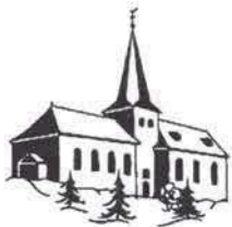
St. Johannes Baptist Rödgen