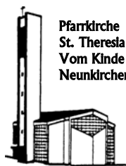
Pfarrkirche St. Theresia Vom Kinde Jesu Neunkirchen

Pfarnachrichten der kath. Pfarrgemeinde St. Theresia vom Kinde Jesu im Pastoralverbund Südliches Siegerland