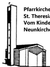
Pfarrkirche St. Theresia Vom Kinde Jesu Neunkirchen

Pfarnachrichten der kath. Pfarrgemeinde St. Theresia vom Kinde Jesu im Pastoralverbund Südliches Siegerland