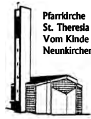
Pfarrkirche St. Theresia Vom Kinde Jesu Neunkirchen

Pfarnachrichten der kath. Pfarrgemeinde St. Theresia vom Kinde Jesu im Pastoralverbund Südliches Siegerland