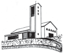
Maria Königin Eisern